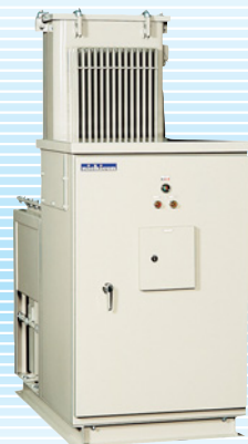
高圧進相コンデンサ設備 “パックコン®”