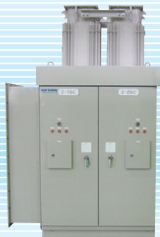
高圧進相コンデンサ設備 “ツインパックコン”