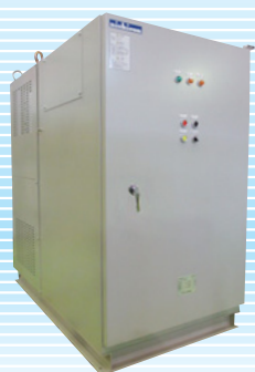
高圧進相コンデンサ設備 “低背形パックコン”